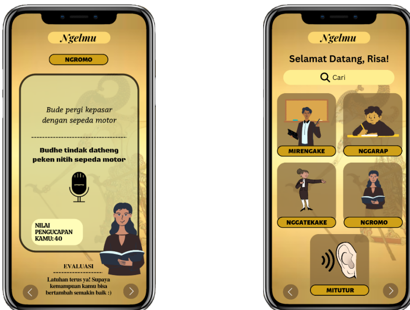
Gambar 1. Tampilan Aplikasi Ngelmu pada HP

Ngelmu merupakan gagasan penulis yang berfokus pada pengenalan Cerita Panji melalui aplikasi yang berbasis pada kombinasi Augmented Reality dan game-based learning . Aplikasi ini dibuat untuk menciptakan pembelajaran yang tidak terkesan membosankan dan monoton karena penulis memahami bahwa pembelajaran sejarah seperti cerita-cerita rakyat akan mudah terlupakan mengingat sifatnya yang kompleks. Sasaran aplikasi ini adalah anak-anak usia sekolah dasar. Hal ini dikarenakan bahwa pada jenjang sekolah dasar, proses perkembangan otak dan daya pikir sedang terbentuk. Mereka juga dipandang sebagai generasi dengan usia emas karena kapasitas memorinya masih terbilang baik dan kuat. Pada dasarnya, asal usul penamaan Ngelmu apabila diterjemahkan ke dalam Bahasa Indonesia memiliki arti menuntut ilmu yang diharapkan dari aplikasi ini adalah dapat mencetak generasi sekolah dasar yang paham dan ‘ngajeni’ kebudayaan Jawa. Selain itu, pesan tersirat dari aplikasi ini adalah untuk mengajak serta mempromosikan kearifan lokal yang sudah dirawat oleh para leluhur sehingga sudah menjadi aturan tak tertulis bagi para generasi untuk menggaungkan citra Cerita Panji tersebut ke generasi selanjutnya.